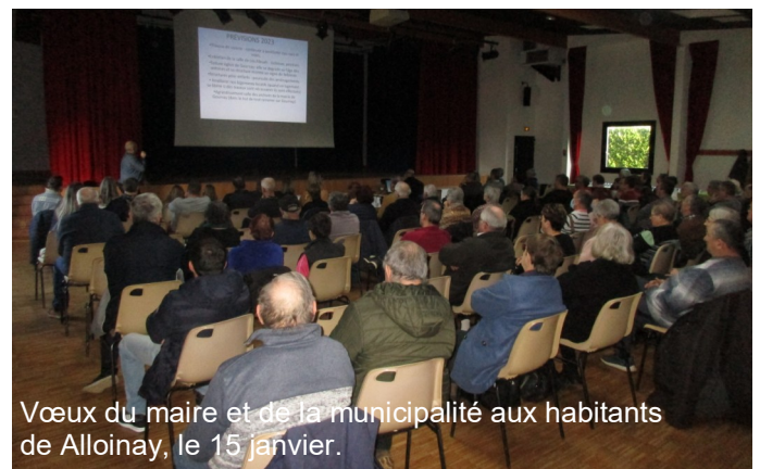
Vœux du maire et de la municipalité aux habitants de Alloinay, le 15 janvier.

A tous, nous vous adressons une année 2023, la plus sereine possible et une bonne santé