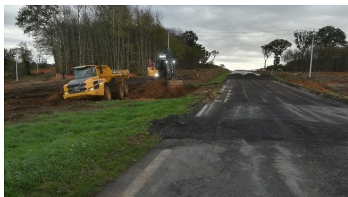
Emplacement de l'ouvrage d'art ( pont).