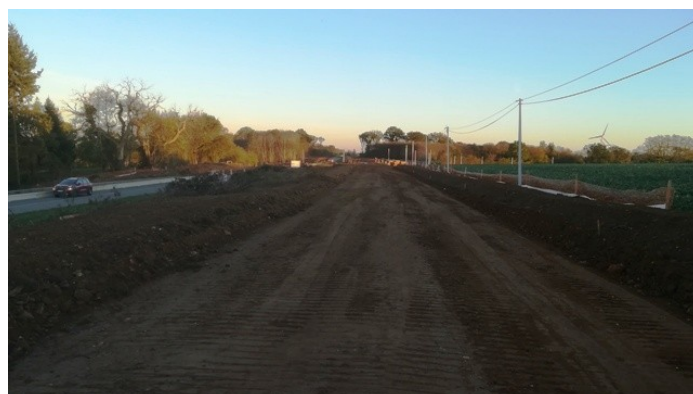
Emplacement de la voie parallèle à la RD 948

Un pont sera construit pour permettre la circulation des usagers qui empruntent la D 105 de Chef-Boutonne à Lezay. Ce pont passera sous la RD948. Il n'y aura pas de connexion directe entre la RD 105 et la RD 948. Les usagers devront rejoindre le carrefour aménagé de Maisonnay par la voie latérale à la RD 948. La construction de l'ouvrage nécessite de terrasser l'actuelle RD 948 à une profondeur de 7 m environ pour réaliser les fondations soit 300 m 3 de déblais à extraire.